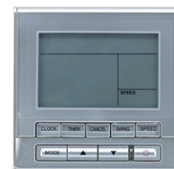
TRÅDBUNDEN STYRENHET KJR90A TILLVAL