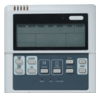
TRÅDBUNDEN STYRENHET KJR12B TILLVAL