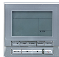
TRÅDBUNDEN STYRENHET KJR90A TILLVAL