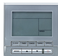
TRÅDBUNDEN STYRENHET KJR90A TILLVAL